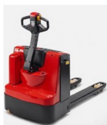
Réf : 366